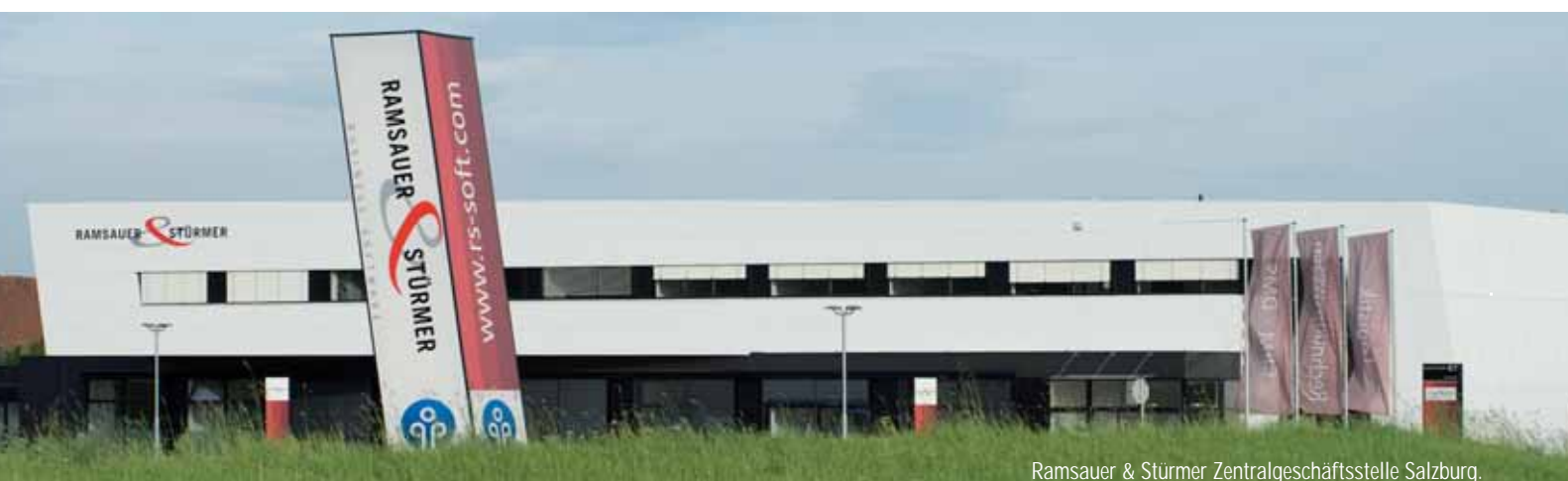
Ramsauer & Stürmer Zentralgeschäftsstelle Salzburg.

Der universitäre Background bildet den Grundstein unserer Softwarephilosophie. Engagierte und betriebswirtschaftlich denkende Programmierer, Consulting-Teams mit Branchenkompetenz sowie erfahrene und gut ausgebildete Projektleiter garantieren für die erfolgreiche Umsetzung. Bei der Entwicklung unserer Unternehmenslösungen stehen die Menschen, die sie benützen, im Mittelpunkt.